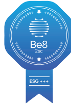
CATEGORIA 3: ESG+++