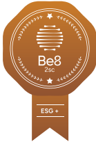
CATEGORIA 1: ESG+