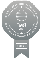
CATEGORIA 2: ESG++